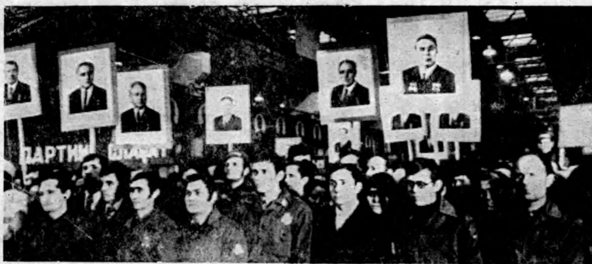
Митинг в третьем корпусе по случаю приветственного письма товарища Л. И. Брежнева строителям Атоммаша.